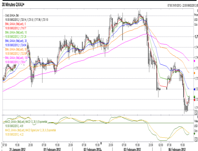
Gold 30 minutes