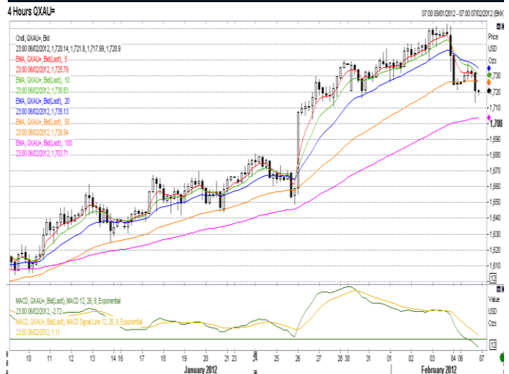
Gold 4 hours

ฉบับนี้จัดทำขึ้นเพื่อวัตถุประสงค์สำหรับใช้เป็นข้อมูลในการปฏิบัติงานของ บริษัท เอ็มทีเอส โกลด์ จำกัด และสำหรับลูกค้าที่บริษัทกำหนดเท่านั้น ข้อมูลในเอกสารนี้จัดทำเตรียมขึ้นเพื่อจูงมุงหมายในการให้ข้อมูลความเห็น และบทวิเคราะห์อาจเปลี่ยนแปลงได้โดยไม่ต้องแจ้งให้ทราบล่วงหน้า ข้อมูลในเอกสารฉบับนี้เป็นข้อมูลที่บริษัทเชื่อว่าถูกต้อง แต่บริษัทมิได้รับรองความถูกต้องแท้จริงและความสมบูรณ์ของข้อมูลดังกล่าว เอกสารฉบับนี้มิใช่การเสนอหรือชี้ชวนให้ซื้อหรือขาย บริษัทและหรือผู้เขียนจะไม่รับผิดชอบใดๆ ในความสูญเสียหรือเสียหายที่เกิดขึ้นจากการใช้ข้อมูลที่ระบุในเอกสารฉบับนี้